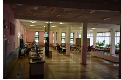
Столовая корпуса Е