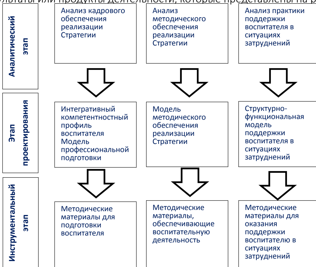
Рис. 3. Результаты (продукты) педагогического сопровождения реализации Стратегии развития воспитания до 2025 года

Результаты реализации выделенных этапов педагогического сопровождения по трем содержательным направлениям позволят получить результаты или продукты деятельности, которые представлены на рисунке 3.