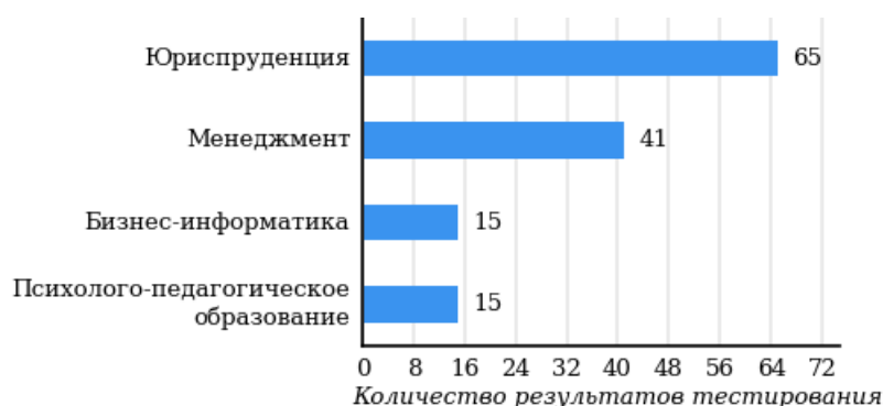
Рисунок 2.3 – Распределение количества результатов тестирования студентов по направлениям подготовки

В Федеральном интернет-экзамене для выпускников бакалавриата приняли участие 136 студентов вуза по 4 направлениям подготовки (рисунок 2.3).