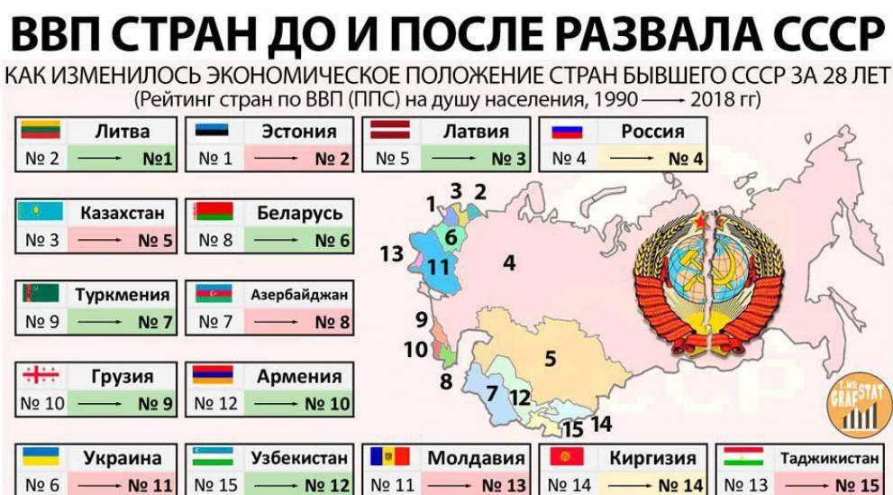
ИЗМЕНЕНИЕ ВВП (ППС) НА ДУШУ НАСЕЛЕНИЯ С 1990 ПО 2018 ГГ, $

1. Используя предложенную инфографику, проанализируйте изменения ВВП стран – республик бывшего Советского Союза в период с 1991 по 2018 гг.